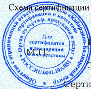
Схема сертификации № 1с.